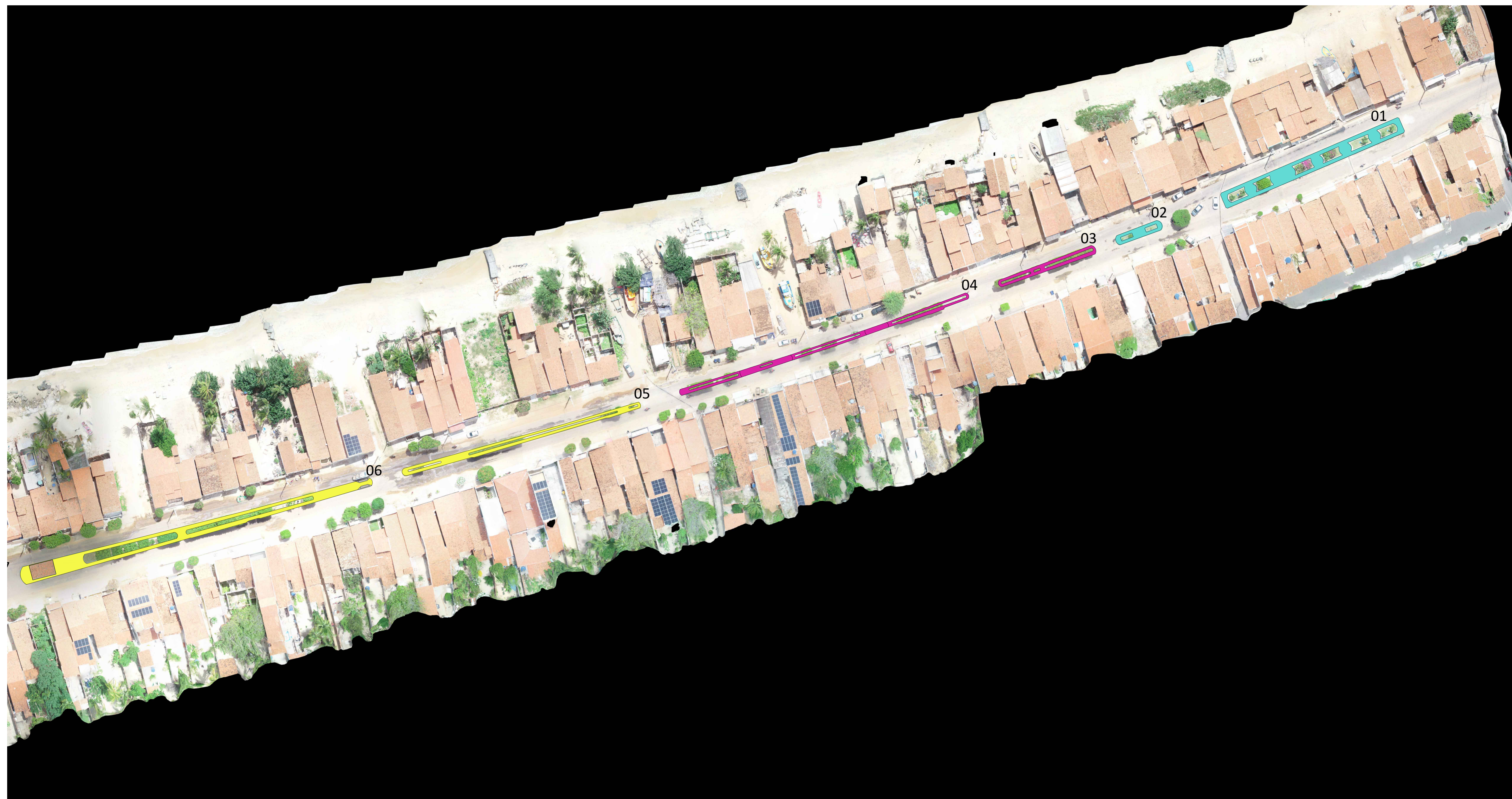
PLANTA DE LOCALIZAÇÃO ESCALA.....1/550